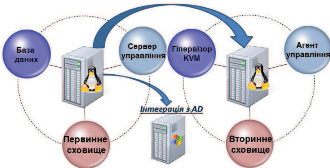
Рис. 1. Структурна схема моделі віртуальної лабораторії

Як відомо системні вимоги щодо розгортання Cloudstack передбачають використання двох комп'ютерів, один з яких виконуватиме функції сервера управління та первинного сховища, а інший відповідатиме за роботу віртуальних машин (гіпервізор) та містить вторинне сховище. Структурну схему реалізованої моделі віртуальної лабораторії подано на рис. 1.