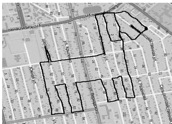
Рис.3. Малюнок-трек, виконаний на території Довгинцівського р-ну м. Кривого Рогу