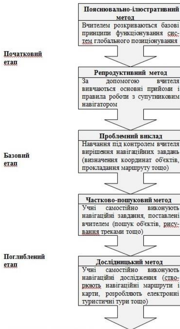
Рис.1. Взаємозв'язок методів навчання і основних етапів вивчення супутникової навігації в школі

Поступовість і поетапність формування знань і умінь в учнів при роботі з супутниковим навігатором обумовлює необхідність конструювання спеціальних навчальних завдань у рамках шкільної географічної програми. Вони дозволяють, з одного боку, забезпечити засвоєння учнями програмного матеріалу, рекомендованого Державним стандартом базової середньої освіти, незалежно від їх здібностей, підготовки і можливостей. З іншого боку, передбачають максимальну диференціацію навчального географічного матеріалу, оскільки припускають поступове підвищення рівня складності від вправ необхідного мінімуму до завдань підвищеної складності