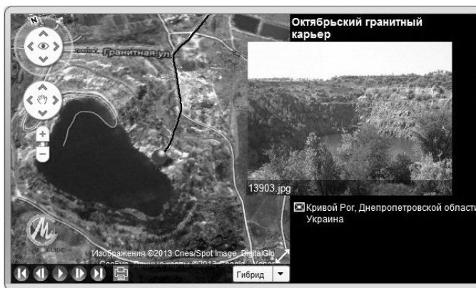
Рис. 4. Вікно сайту M-Guide з інформацією про мультимедійний GPS путівник «Геологічні пам'ятки Криворіжжя» з візуалізацією об'єкта № 8

Висновки. Технології супутникової навігації являють собою ефективний інструмент в формуванні геоінформаційної компетентності учнів, а супутниковий навігатор постає в ролі нового технічного засобу навчання. Використання супутникової навігації наповнює новим сенсом, змістом і мотивацією краєзнавчу складову шкільних курсів географії, дозволяє повному поглянути на самостійну, дослідницьку позаурочну діяльність учнів.