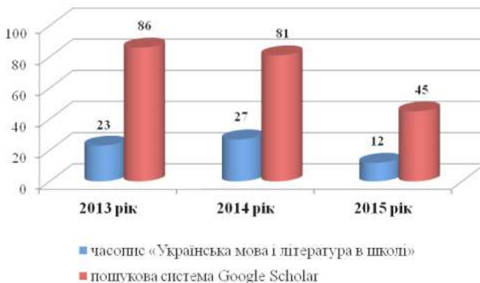
Рис. 2. Показники покликань/цитувань за роками.