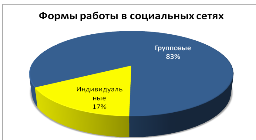
Рис. 3. Выбор студентами форм работы в социальных сетях

Проведенный опрос показал, что все студенты используют социальные сети для общения в личных целях, из них более половины опрошенных пользуются социальными сервисами для обучения и научной деятельности. При этом уже на первом курсе примерно 20 % студентов применяют социальные сети в целях, связанных с будущей профессиональной деятельностью.