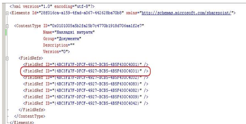
Рис. 2. Опис показників на мові XML (фізична модель)

На рис. 2 представлено опис документу «Накладні витрати» на мові XML (фізична модель даних), де обведено ідентифікатор показника «Номер договору».